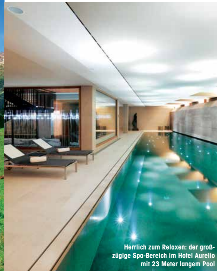
Herrlich zum Relaxen: der großzügige Spa-Bereich im Hotel Aurelio mit 23 Meter langem Pool