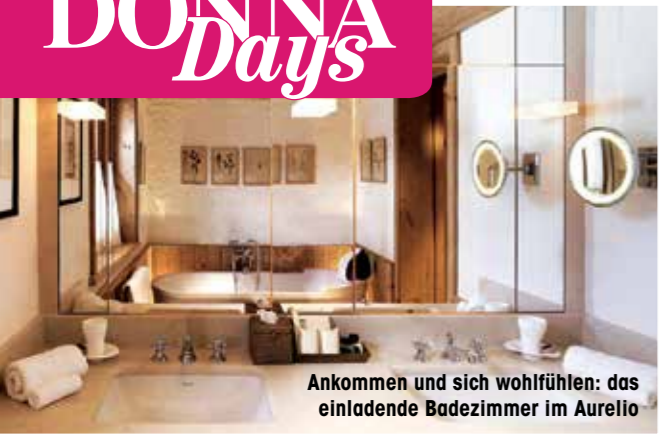
Ankommen und sich wohlfühlen: das einladende Badezimmer im Aurelio