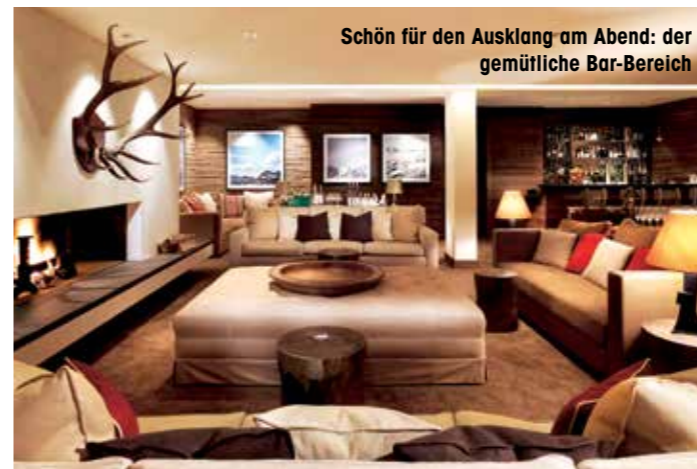
Schön für den Ausklang am Abend: der gemütliche Bar-Bereich