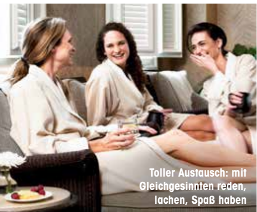
Toller Austausch: mit Gleichgesinnten reden, lachen, Spaß haben